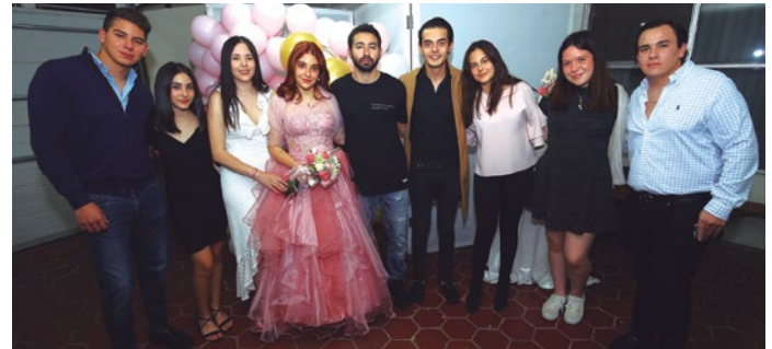
Sus primos la acompañaron en esta celebración especial.