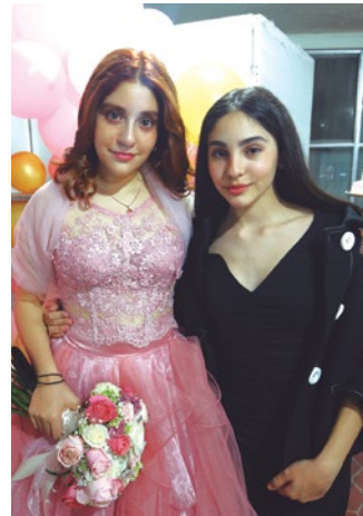
Gratos momentos pasó junto a su hermana Loredana.