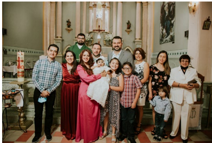
Muy contenta con su familia en el festejo.